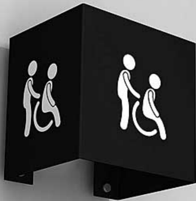
تابلوهای عمود بر دیوار، ساخته شده از جنس پلکسی گلاس نصب با یراق آلومینیومی