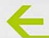
تابلوهای مسطح دیواری، ساخته شده از جنس پلکسی گلاس