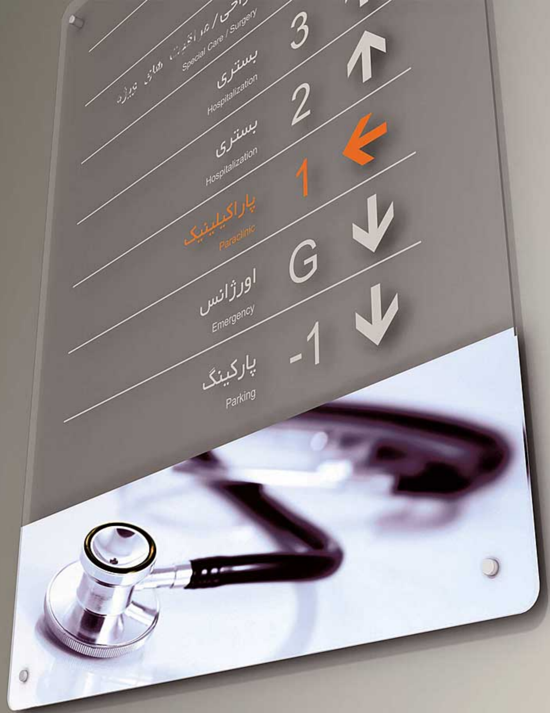
تابلوهای مسطح دیواری، ساخته شده از جنس پلکسی گلاس