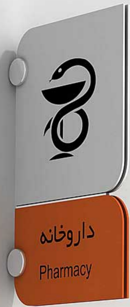
تابلوهای عمود بر دیوار، ساخته شده از جنس پلکسی گلاس نصب با یراق آلومینیومی