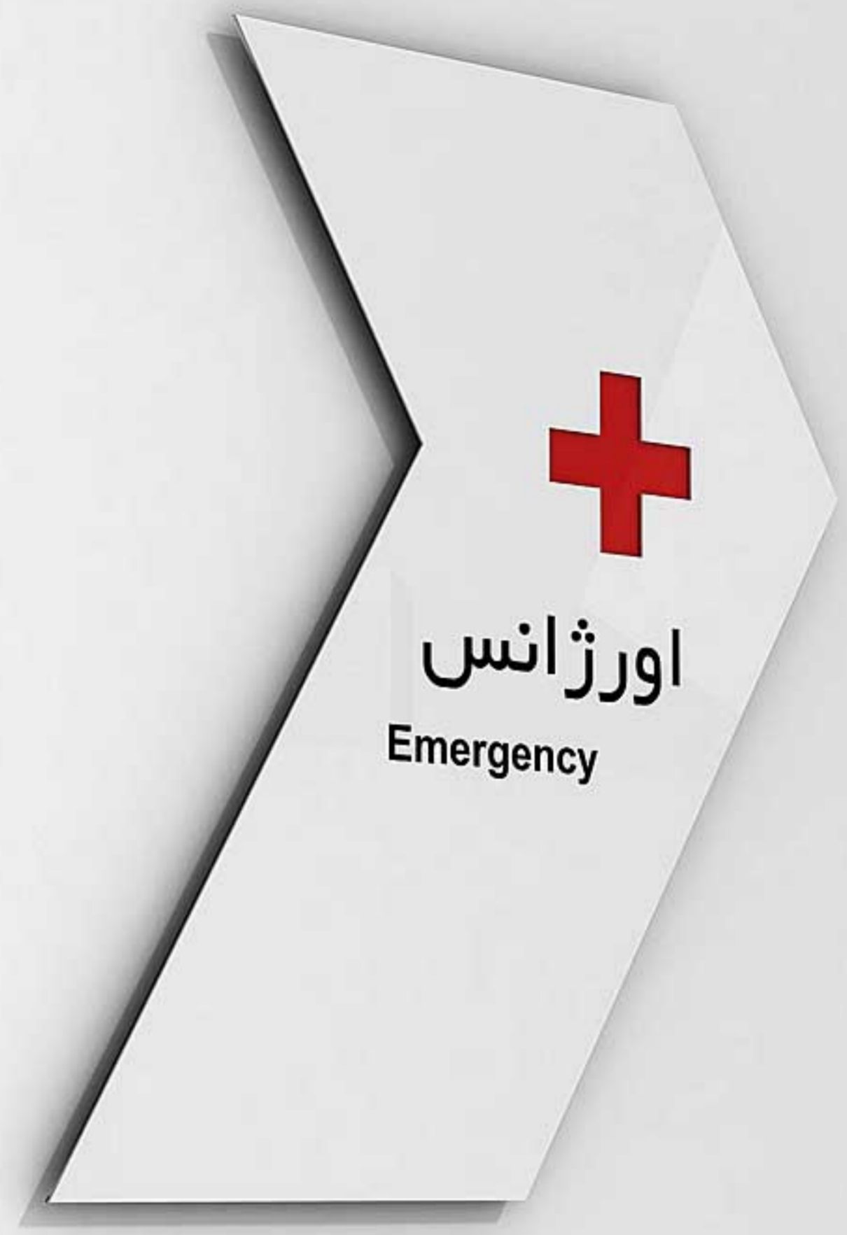
تابلوهای مسطح دیواری، ساخته شده از جنس پلکسی گلاس