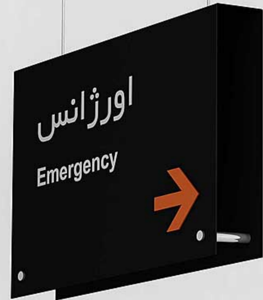
تابلوهای آویز، ساخته شده از جنس پلکسی گلاس